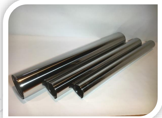
แร็คกิ้ง ทางตรง