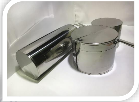
หน้าแปลน แคน