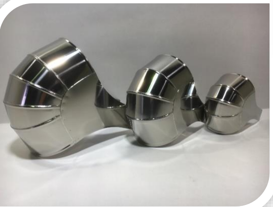
แร็คกิ้ง ข้องอ