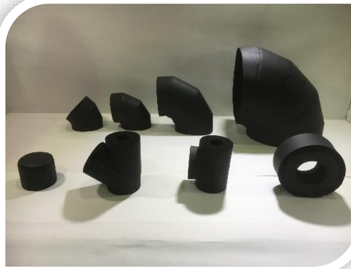
ข้องอ ข้อต่อ สามแยก วาย ที