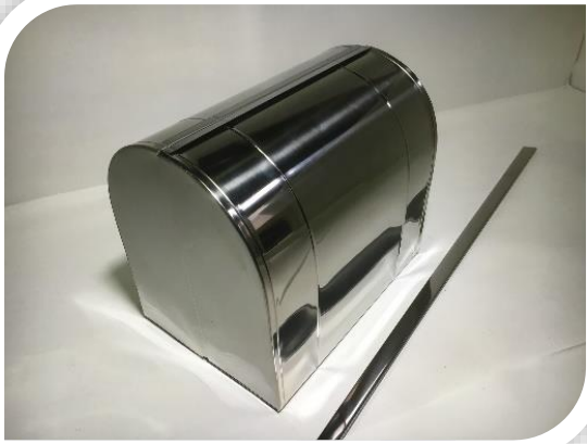
กล่องวาล์ว